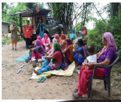
प्रशिक्षण प्राप्त करती महिलाओं का समूह।

धर्मशाला (रकड़) : आजकल अखबारों में महिलाओं के शोषण की खबरें बढ़ रही हैं। ऐसा ही एक मामला नगरोटा में एक महिला के साथ हुआ। महिलाओं के घरवालों न उसके साथ मारपीट की, साथ ही उसे दहेज के लिए प्रताड़ित किया। महिला के साथ हिंसा इतनी बढ़ गई कि घर से बाहर निकलना मुश्किल हो गया जिसकी वजह से उसे किसी की मदद नहीं मिल पाई। एक दिन वह एक महिला से मिली, जो जागोरी नाम के गैर सरकारी संगठन में काम करती है। वह औरत उसे अपने गैर सरकारी संगठन में ले गई, जिसमें वह कार्य करती थी। वह महिला जागोरी में काम करने वाली अन्य महिलाओं से मिली। गैर सरकारी संगठन में काम करने वाली महिलाओं के साथ रहकर वह अपने हक के लिए लड़ी। महिलाओं के खिलाफ अपराध दुनिया भर में बढ़ रहा है। महिलाओं के प्रति बढ़ते हुए अपराध का प्रमुख कारण लैंगिंग असमानता है। जागोरी का कार्य गांवों में औरतों के साथ हो रही हिंसक घटनाओं, के बारे में समाज को जागरूक करना है। जागोरी में कार्य करने वाली महिलाएं लोगों के घरों में जाकर महिलाओं को जागरूक करती हैं। जिन औरतों के पास समय नहीं है या अपने घरेलू कार्य में उलझी महिलाएं हैं, उन्हें उनके घर जाकर उनके अधिकारों के प्रति जागरूक करती हैं। जागोरी में महिलाओं को शिक्षित करने के लिए अभियान को चलाने का लक्ष्य यही है कि औरतें जो बातें अपने घर के लोगों के सामने या पुरुषों के सामने नहीं रख सकती, वह इन अभियानों के द्वारा बताती हैं।