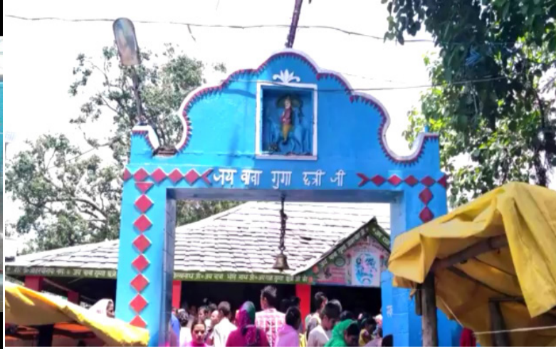
गुग्गा जी महाराज का प्रसिद्ध मंदिर।