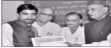
स्टाफ रिपोर्टर, परागपुर